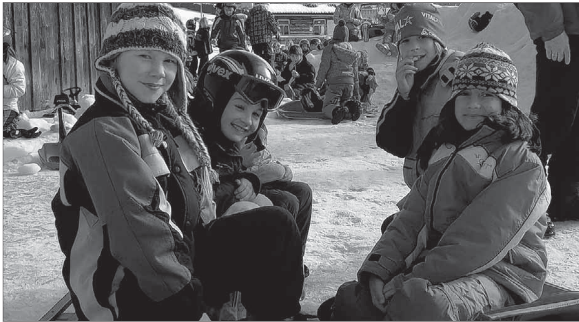
Ein Tag im Schnee macht hungrig und jeder freute sich auf die Stärkung mit Wurst und Wecken, die von der Gemeinde Böttingen gespendet wurde.

Wer aber lieber auf Schusters Rappen unterwegs war, der beteiligte sich an der Schneewanderung nach Mahlsetten und wieder zurück.