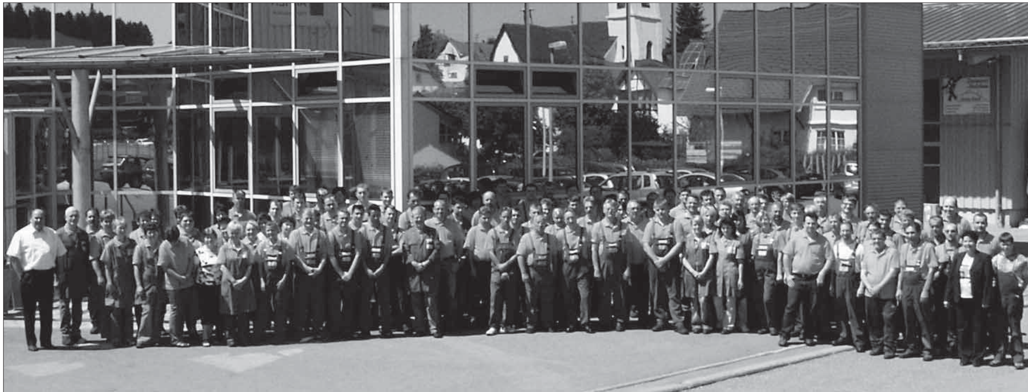
Rund 125 Köpfe zählt derzeit das Mitarbeiter-Team der „Aicher-Familie“ – hier vor dem Gebäude in Königsheim Lindenwiesen 4.