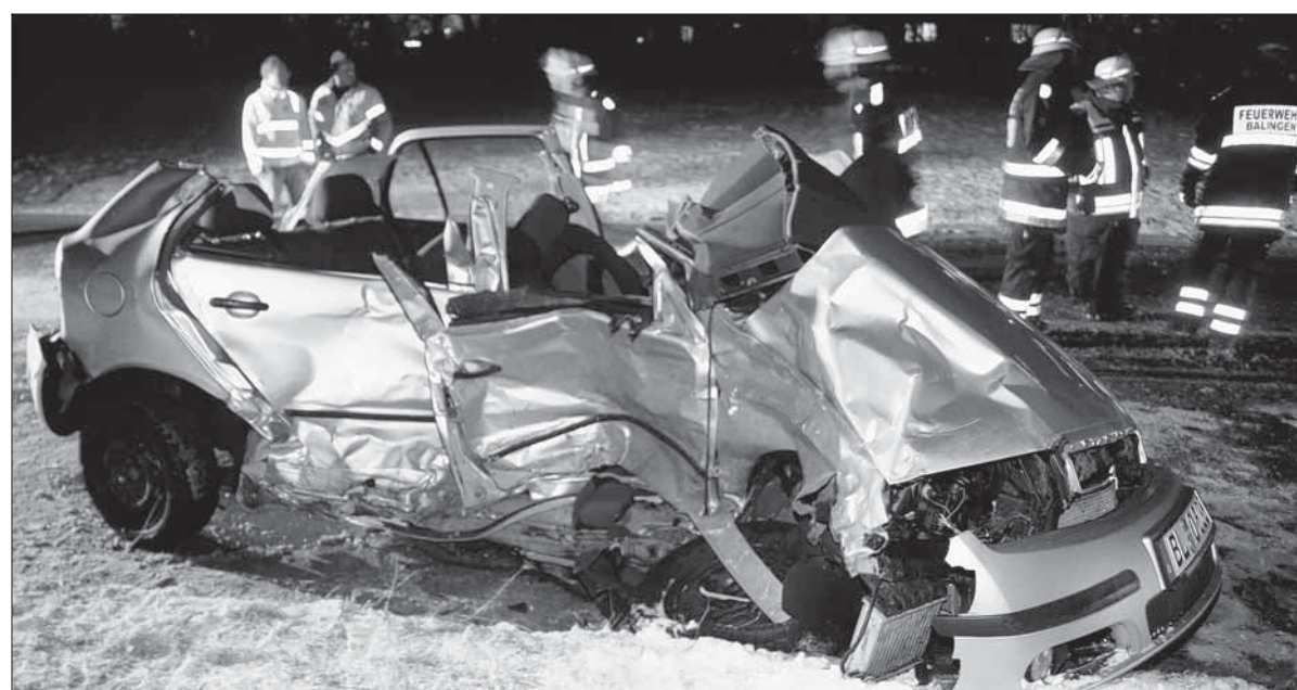
Die Feuerwehr musste das Dach des total beschädigten Autos auftrennen, um den Leichnam zu bergen.